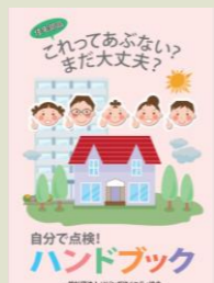
(リビングアメニティ協会発行)