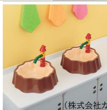
(株式会社カクダイ)