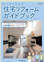
(住宅リフォーム推進協議会発行)

リフォーム用ガイドブック2冊を、ご希望の方に差し上げます。ご自宅の設備などのセルフチェックや知っておきたい情報が満載、イラストも多くわかりやすく説明されています。(2024年5月末まで受付、なくなり次第終了)