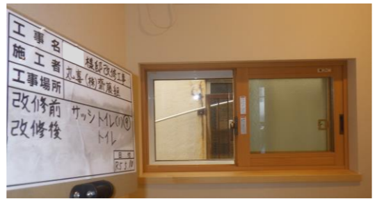
「先進的窓リノベ」内窓設置改修事例

家庭からのCO 2 排出量を用途別に見ると、照明・家電製品30.9%、自動車25.5%、暖房15.6%、給湯13.7%という報告もできています。(全国地球温暖化防止活動推進センターHPより)