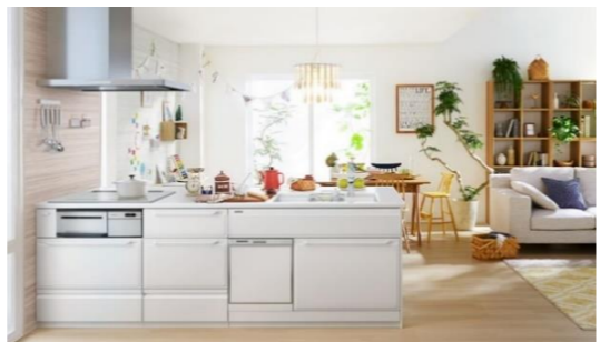
「こどもエコすまい」対面キッチンへの改修事例

冬場に寒くて結露してしまう窓辺、最新の設備だと光熱費も抑えられる？お風呂だって新しくしたいし...夏場のエアコンも欠かせなくなって、温暖化も心配。でも何を今、住まいにおいて替えるべきなんだろう。