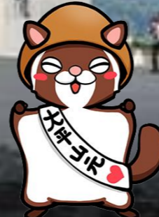
大平山元遺跡もりあげ隊キャラクター「むーもん」